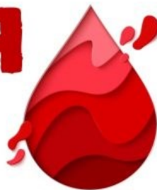
СХЕМА НАСЛЕДОВАНИЯ ГЕМОФИЛИИ НАСЛЕДСТВЕННАЯ БОЛЕЗНЬ

Гемофилия наследственное заболевание, при котором нарушается процесс свертывания крови. Болезнь проявляется кровоизлияниями в суставы, мышцы и внутренние органы, которые могут возникать самопроизвольно, в результате хирургического вмешательства или травмы. Кровоизлияния в головной мозг и другие жизненно важные органы могут привести к гибели больного.