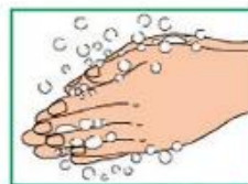
3 Намылить руки