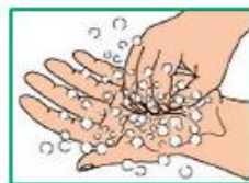
7 Тереть круговыми движениями ладонь левой руки кончиками пальцев правой руки, поменять руки