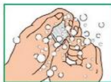
8 При необходимости можно обработать околоногтевую область мягкой щеткой