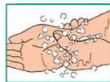
9 Охватить запястье левой руки большим и указательным пальцами правой руки, вымыть. Повторить для запястья правой руки