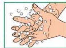
5 Вымыть внутренние поверхности пальцев движениями вверх и вниз