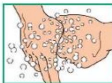
6 Охватить основание большого пальца левой руки большим и указательным пальцами правой руки, вымыть. Повторить для большого пальца правой руки