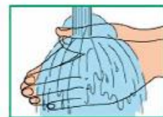
10 Промойте руки под проточной водой