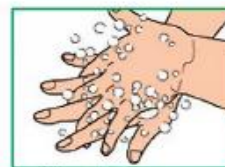
4 Правой ладонью вымыть обратную поверхность левой ладони, поменять руки