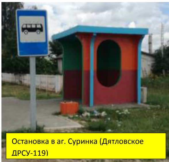
Остановка в аг. Суринка (Дятловское ДРСУ-119)

Государственным учреждением «Слонимский зональный центр гигиены и эпидемиологии» постоянно проводится работа по контролю за санитарным состоянием территорий г. Слонима и Слонимского района.